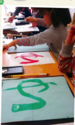
小学校の入学準備に