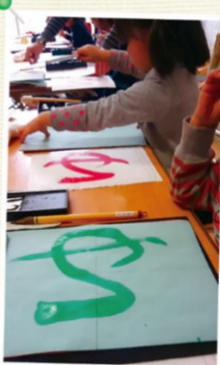
小学校の入学準備に