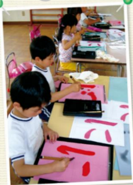
字に興味を持ち始めたら