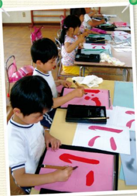
年1回級位認定があるから、目標が立てやすい!